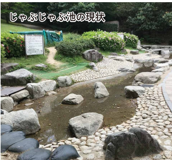
じゃぶじゃぶ池の現状